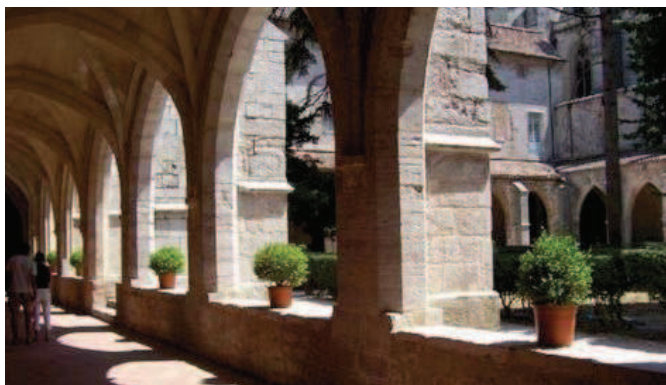
LE CLOÎTRE DE BLANCHE COURONNE

Dans le cartulaire de l'abbaye Saint Cyprien de Poitiers une charte rédigée aux alentours de 1075 parle des biens donnés à cette abbaye par le seigneur Escomard de Lavau. Il est question de droits de pêche, droits de construire des moulins, exemption de péage etc. Ces biens sont situés au Tertre et les droits ont été ensuite récupérés par l'abbaye de Blanche Couronne. Le prieuré portera (conservera ?) le nom de Saint Hilaire, ancien évêque de Poitiers.