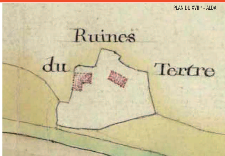
PLAN DU XVIII e - ALDA