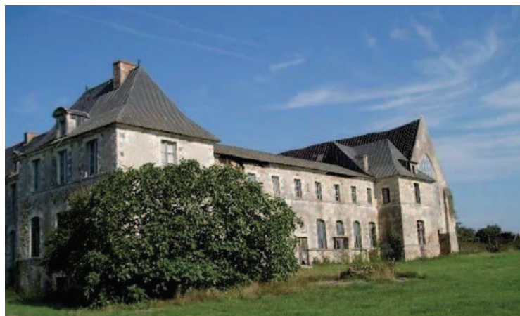
L'ABBAYE DE BLANCHE COURONNE