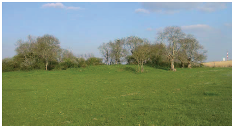
LE TERTRE AUJOURD'HUI

Le groupe se transporta donc à l'église de Bouée pour remplir le reste des formalités. ●