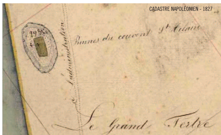
CADASTRE NAPOLÉONNIEN - 1827