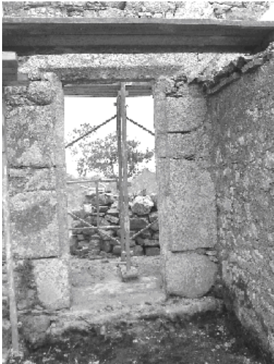
2007 - L'ancienne porte murée réouverte